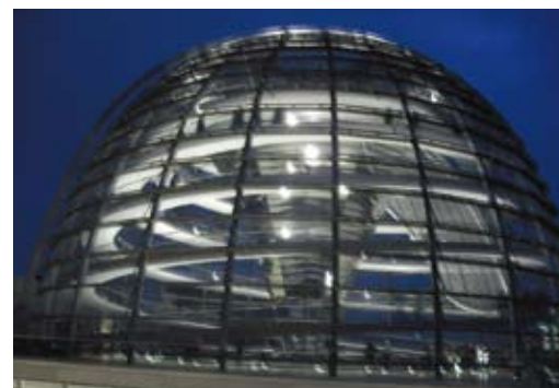
Cupola del Reichstag (sede del Parlamento Tedesco) lotto Daimler-Chrysler, Potsdamer Platz - Berlino

Oggi, come sappiamo, la progettazione di un organismo edilizio comprende vari e molteplici aspetti, tutti però correlati tra di loro, e quindi non scindibili ed affrontabili separatamente, ma in simbiosi, o, come si usa dire, in progress. Si può parlare di progettazione integrata: infatti gli aspetti urbanistici, architettonici, strutturali e impiantistici sono strettamente correlati sia sotto il profilo tecnico-costruttivo che sotto quello legislativo-regolamentare. Allo stesso modo, l'edilizia sostenibile non si riduce al solo impiego di elementi di captazione solare (pannelli solari e fotovoltaici) o al miglioramento