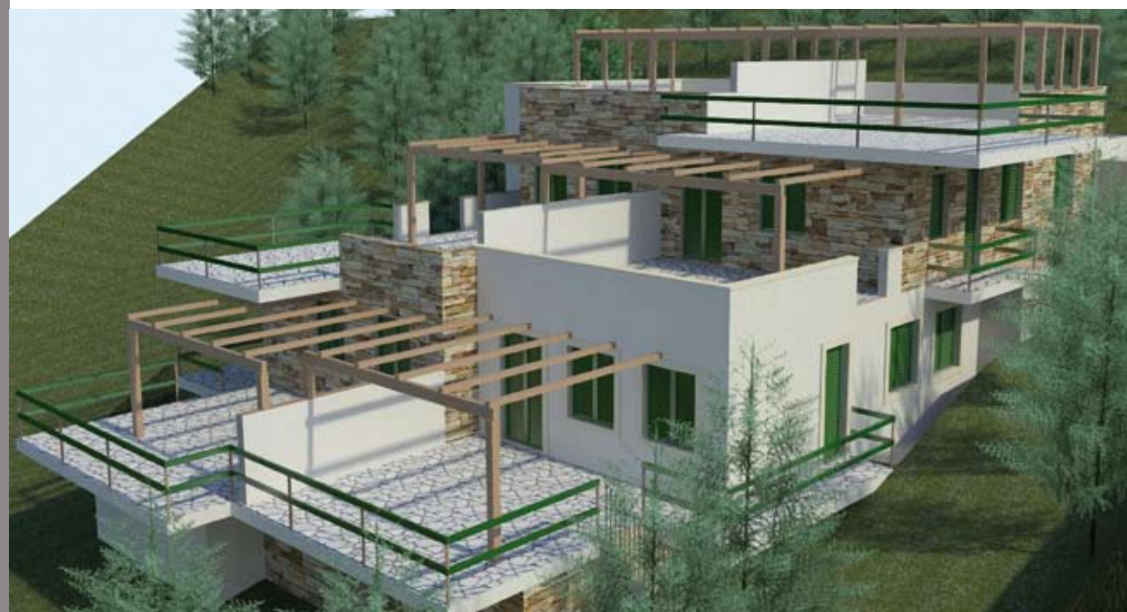
Residenze sostenibili ed eco-compatibili in S.Caterina di Nardò - vista fronti sud ed est

Raffinati esempi di integrazione architettonico-impiantistica si trovano nel recente passato e nel presente all'avanguardia di realtà come la Berlino post-bellica ricostruita: l'ampliamento del Parlamento tedesco in primis (ad opera dell'internazionale ed avanguardistico architetto Norman Foster), realizzato con un sofisticato sistema di riutilizzo di aria e luce prelevati dall'esterno, o gli edifici del "nostro" sempre geniale architetto Renzo Piano costruiti nel "cuore" della città (Potsdamer Platz) con caratteristiche tecnico-costruttive e di isolamento termico tali da consentire di disporre gli ambienti in totale libertà, anche adiacenti a pareti completamente vetrate senza avere, per questo, alcun minore livello di benessere (e lo si dice per esperienza diretta). Con le opportune proporzioni, e riprendendone concetti e filosofia, sistemi e metodi analoghi, applicati nell'edilizia corrente (peraltro, come detto, ad oggi obbligatori per legge), apporterebbero